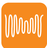
Caídas de tensión